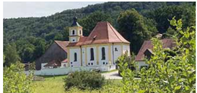
An der Wallfahrtskirche „Zu den drei Elenden Heiligen“ im Dietfurter Ortsteil Griesstetten startet die geplante „Bustour durchs Altmühltal - von Kirche zu Kirche“.

Aktuelle Informationen finden Sie unter www.altmuehl-jura.de , Anmeldung zwingend erforderlich.