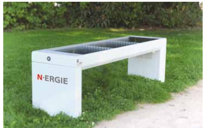
Fünf innovative Solar-Sitzbänke können für Kommunen im Netzgebiet der N-ERGIE erspielt werden.

Das Besondere bei diesem Online-Game: Jede*r Spieler*in, der*die unter www.co2-memo.de/spielen alle Paare gefunden hat, entscheidet selbst, an welche Kommune im Netzgebiet der N-ERGIE sein*ihr Punkt gehen sollen. Die fünf Kommunen mit den meisten Punkten erhalten jeweils eine ibench Solar-Sitzbank für den öffentlichen Raum. Der Spielzeitraum ist vom 4. bis 31. August 2020. Unter allen Teilnehmer*innen verlost die N-ERGIE noch zusätzlich 30 hochwertige Powerbanks.