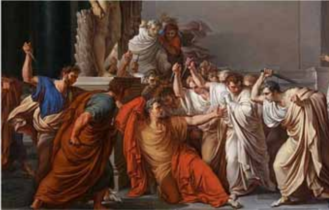
Tod des Cäsar. Vincenzo Camuccini, 1798 (Ausschnitt)

Bekanntlich wurde an diesem Tag, dem 15. März des Jahres 44 v. Chr., Julius Cäsar unmittelbar vor Beginn einer Senatssitzung von Verschwörern hinterrücks erdolcht. Aber warum? Hatte er nicht alles erreicht, was man sich nur denken kann, dieser geniale Mann Roms?