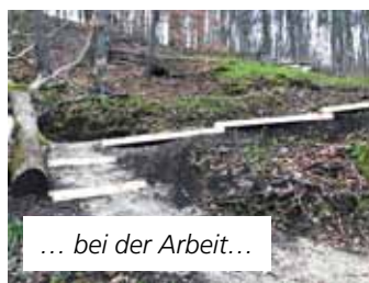
... bei der Arbeit...