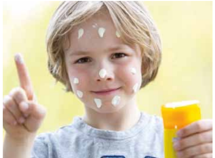
Gut geschützt: Sonnenschutzmittel mit möglichst hohem Lichtschutzfaktor bevorzugen.

www.gesundheitsatlas-deutschland.de ; Hautkrebs frühzeitig erkennen | AOK