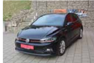
VW Polo GTI DSG 2.0 TSI, 147 kW (200 PS)

EZ 02.2020, 17.904 km, Navigationssystem Discover Media, LM-Felgen 17", LED Scheinwerfer, Klimaautomatik, Sitzheizung vorne, Parksystem vorne und hinten inkl. Rückfahrkamera, TOP Sportsitze vorne, uvm.