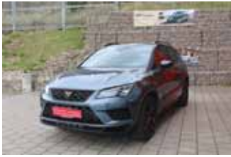
CUPRA Ateca 4Drive DSG 2.0 TSI, 221 kW (300 PS)

EZ 01.2019, 57.366 km, Panoramadach, Navigationssystem, LM-Felgen 19", 360° Kamera, Parklenk-Assistent mit Parksystem vorne und hinten, Winterpaket, Black Package, LED Scheinwerfer, uvm.