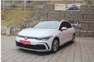
VW Golf 8 GTI DSG 2.0 TSI, 180 kW (245 PS)

EZ 03.2021, 9.150 km, Navigationssystem Discover Media, Panoramastiebedach, LED Scheinwerfer, LM-Felgen 19", ACC Abstandstempomat, Parksystem vorne und hinten, Klimaautomatik, uvm.