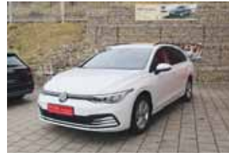
VW Golf 8 Variant Life 1.5 TSI, 110 kW (150 PS)

EZ 08.2021, 23.895 km, Anschlussgarantie 2 Jahre max. 80.000 km, Navigationssystem Discover PRO, LM-Felgen 16", Parksystem vorne und hinten, Business Paket Premium, Sitzheizung vorne, LED Scheinwerfer, uvm.