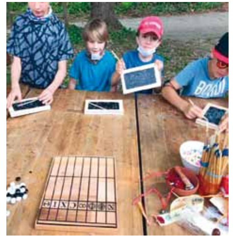
Römische Schule im Museum

Schnitzeljagd durch Kipfenberg – Sehenswürdigkeiten von Kipfenberg im Fokus