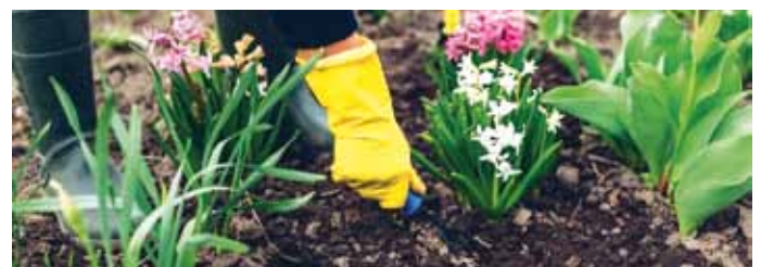
Gartenarbeit ist gut für die Gesundheit.

Wenn im Frühjahr die Gartensaison beginnt, sollte man, wie bei anderen sportlichen Aktivitäten auch, langsam starten, besonders wenn die letzten Aktivitäten bereits länger zurückliegen. „Ein paar Aufwärm- und Dehnungsübungen können durchaus sinnvoll sein, um den Körper vorab in Schwung zu bringen“, so Rainer Stegmayr. Wichtig ist es auch, dass man nicht dauernd gebückt oder auf den Knien arbeitet. Gartenfreunde sollten immer möglichst viel aus den Beinen und nicht